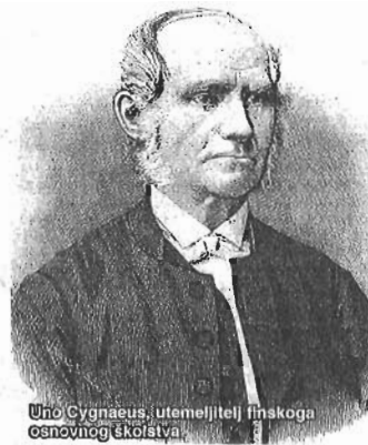
Uno Cygnaeus, utemeljitelj finskoga osnovnoga školstva.

Finski je parlament 1963. godine donio ključnu odluku kako su javno